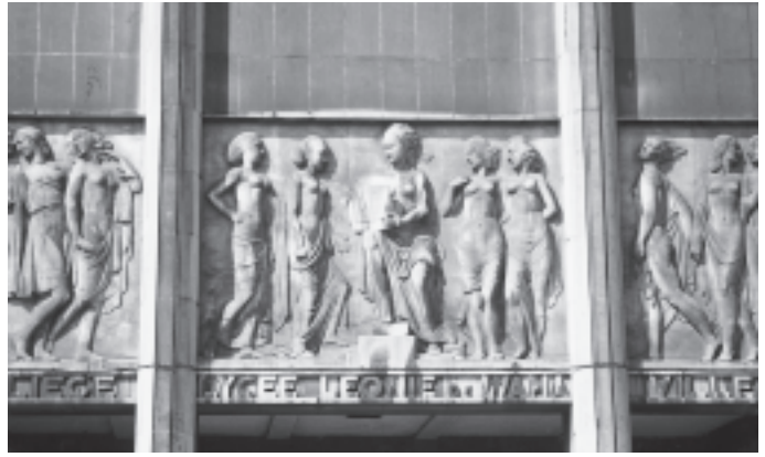
Liège, Lycée Léonie de Waha : Relief central de la façade, dû à Adelin SALLE

Inauguré en 1938, le Lycée constitue un témoin de l'art moderne en Wallonie, et témoigne d'une synergie parfaite entre des acteurs politiques soucieux du progrès culturel et social. Vu les dégradations qui altèrent aujourd'hui des composantes de l'édifice et de ses œuvres, notamment les mosaïques, il est urgent qu'un programme de restauration soit envisagé avec les services de la Région wallonne en charge du patrimoine et la CRMSF. A côté des opérations de maintenance (aux châssis métalliques, notamment), la restauration des œuvres d'art nécessite des budgets conséquents.