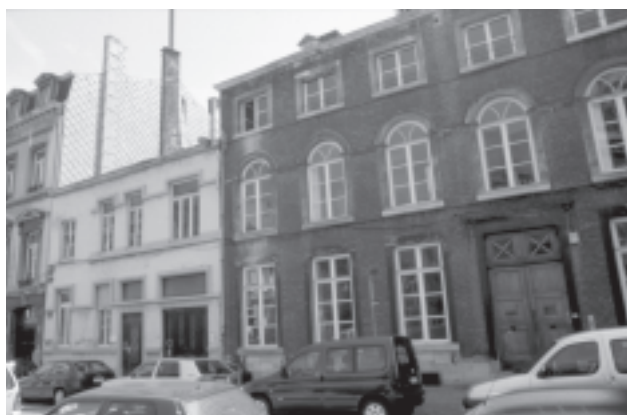
Façades des n°9 et 10 place Emile Dupont à Liège

Edifié au XIV ème siècle à l'extrémité orientale de l'aile sud du cloître, cet édifice se révèle être le dernier vestige, en élévation, des bâtiments claustraux de l'abbaye de Saint-Jacques. La conservation d'une très large part des façades, de la charpente et des aménagements intérieurs