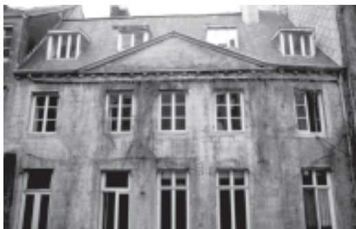
Façade arrière du n°9 place Emile Dupont à Liège

Caroline Bolle & Jean-Marc Léotard Ministère de la Région wallonne - service de l'archéologie en province de Liège