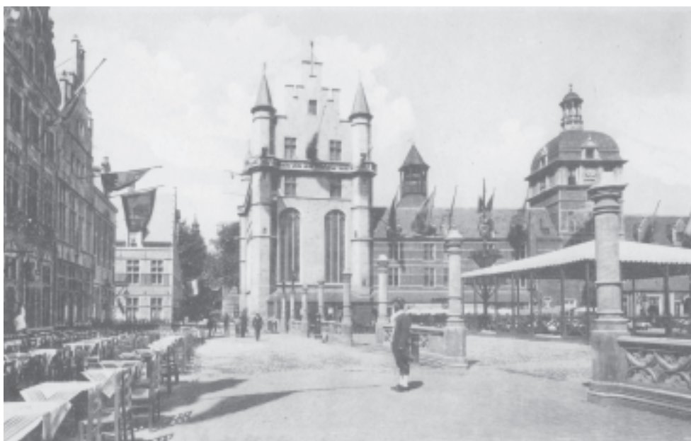
Carte postale présentant une vue de la place des Bailles reconstituée en 1935.

Enfin, le Vieux Bruxelles était doté d'égouts, d'alimentations en eau courante, électricité et gaz. Les rues et places furent pavées. L'éclairage public à l'électricité sur la place des Bailles fut camouflé sur de faux mâts de feux d'artifices. Même le téléphone fut