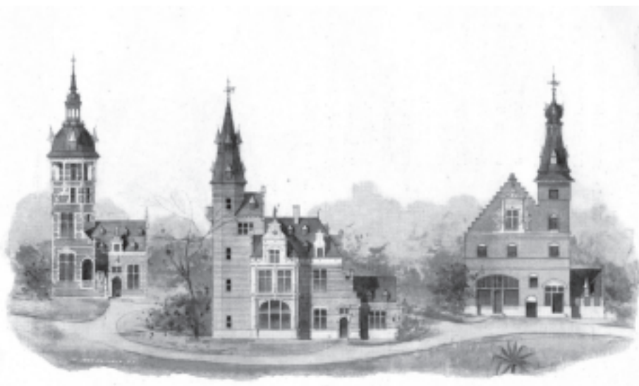
Style Embrugeois, XVIIe siècle

Ce bulletin est publié avec l'aide de la Région wallonne et de la Région de Bruxelles-Capitale.