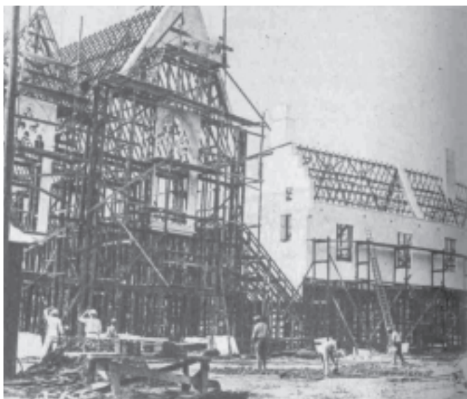
Le chantier de construction de la réplique de l'église Saint-Jacques sur Coudenberg et des maisons de l'ancienne rue du Coudenberg. Bulletin Officiel de l'Exposition N°13, 15 août 1934.